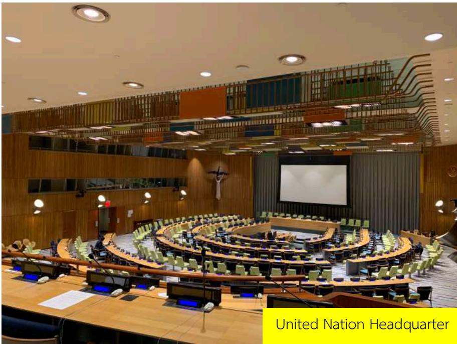
United Nation Headquarter