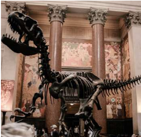
Museum of Natural History