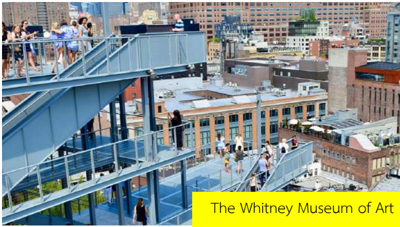
The Whitney Museum of Art