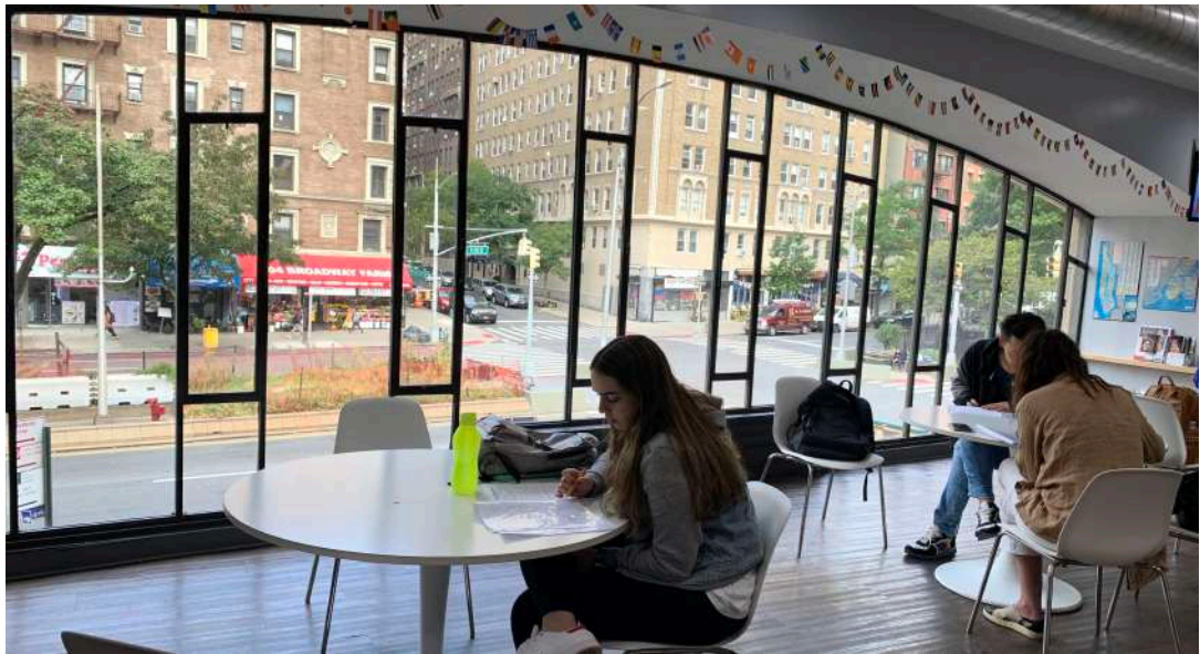
โรงเรียน: New York Language Center (Upper West Side, Manhattan, New York, NY)