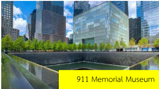
911 Memorial Museum