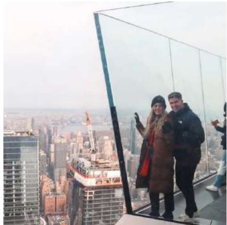
The Edge Hudson Yards Observation Deck