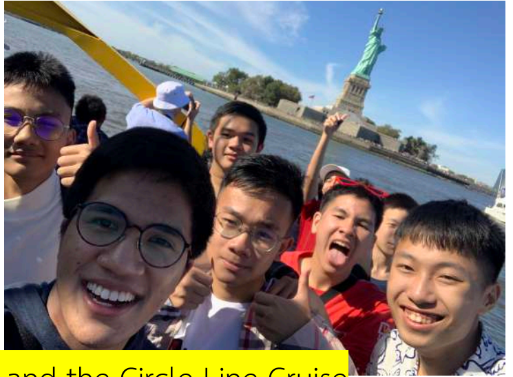
Statue of Liberty and the Circle Line Cruise