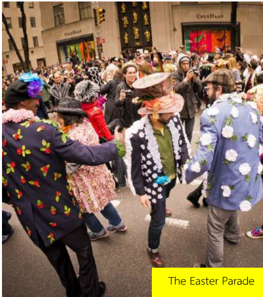
The Easter Parade