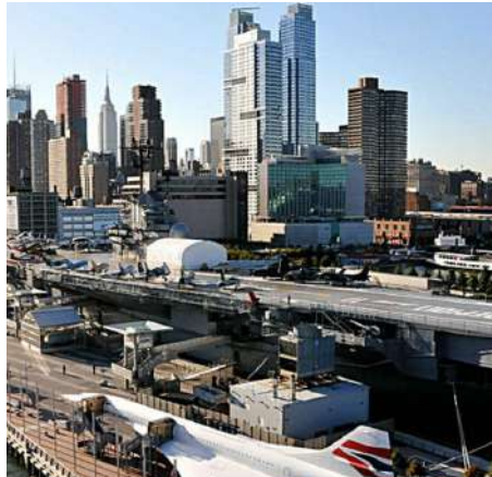
Sea, Air, and Space Museum