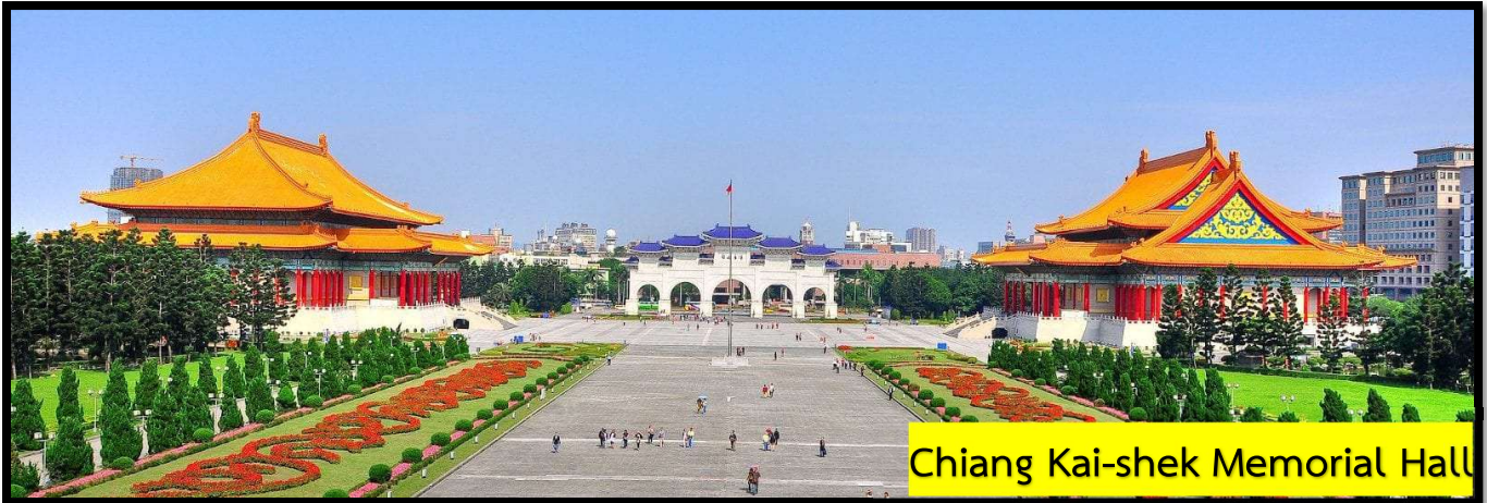
Chiang Kai-shek Memorial Hall