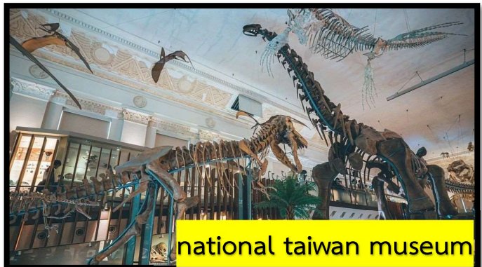
national taiwan museum