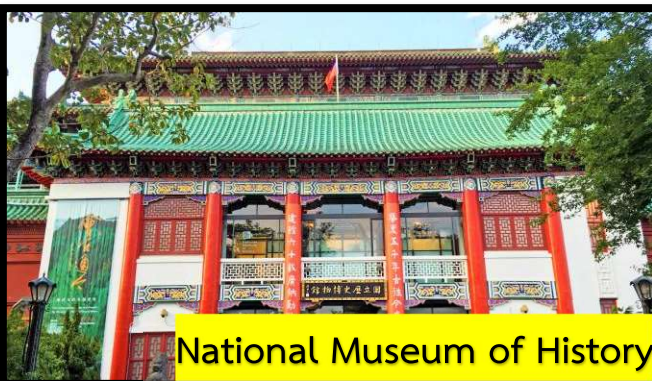
National Museum of History