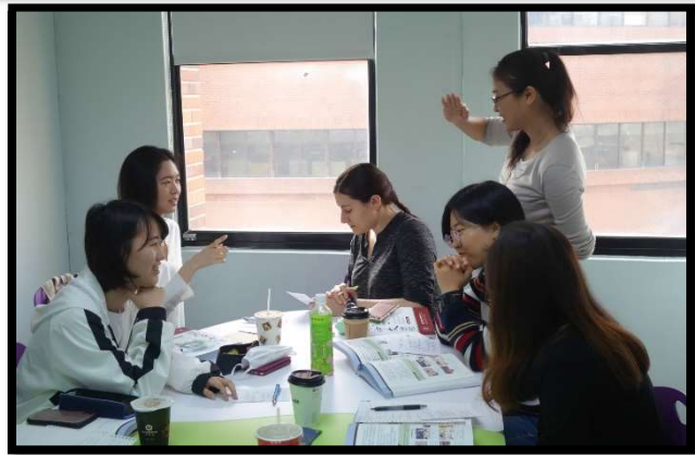
โรงเรียน: Mandarin Training Center (National Taiwan Normal University, Taipei, Taiwan)