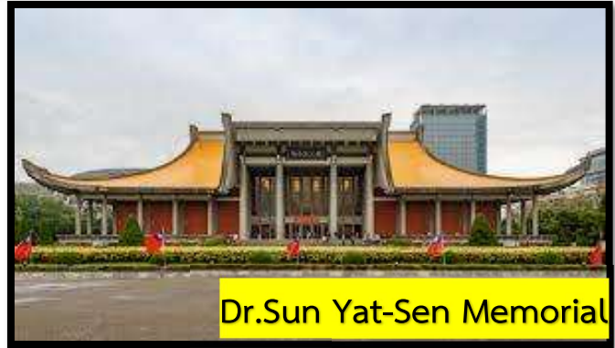
Dr. Sun Yat-Sen Memorial Hall