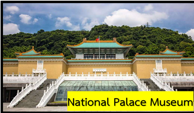
National Palace Museum